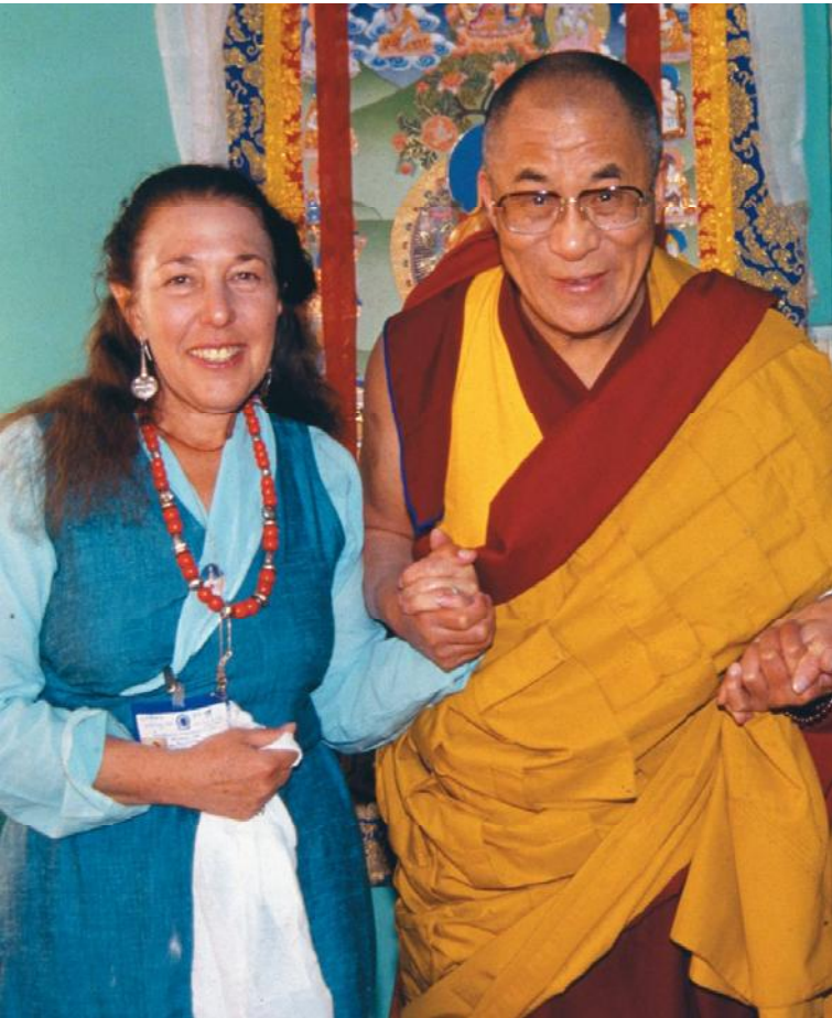
BEI DER ERFORSCHUNG VON BUDDHISTISCHEN KLÖSTERN IM HIMALAYA IST DAS TREFFEN MIT DEM DALAI LAMA GERADEZU „PFLICHT“.