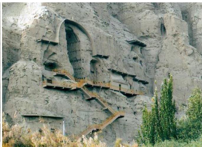
IN DEN HÖHLEN DER TAKLAMAKAN-WÜSTE BLIEBEN DIE TOCHARISCHEN SCHRIFTSTÜCKE MEHR ALS 1500 JAHRE FÜR DIE NACHWELT KONSERVIERT. HEUTE SOLL DIE ARBEIT EINES INTERNATIONALEN FORSCHUNGSTEAMS AUCH DIE HÖHLEN UND DEREN INSCRIFTEN VOR DEM VERFALL SCHÜTZEN.