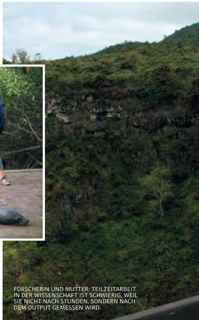
FORSCHERIN UND MUTTER: TEILZEITARBEIT IN DER WISSENSCHAFT IST SCHWIERIG, WEIL SIE NICHT NACH STUNDEN, SONDERN NACH DEM OUTPUT GEMESSEN WIRD.

Machtverlust Aber woran scheitert es? Die Mutter eines fünfjährigen Sohnes vermutet dahinter, neben zu hohen Lohnnebenkosten, auch die Angst um Machtverlust: Je eher jemand bereit wä-