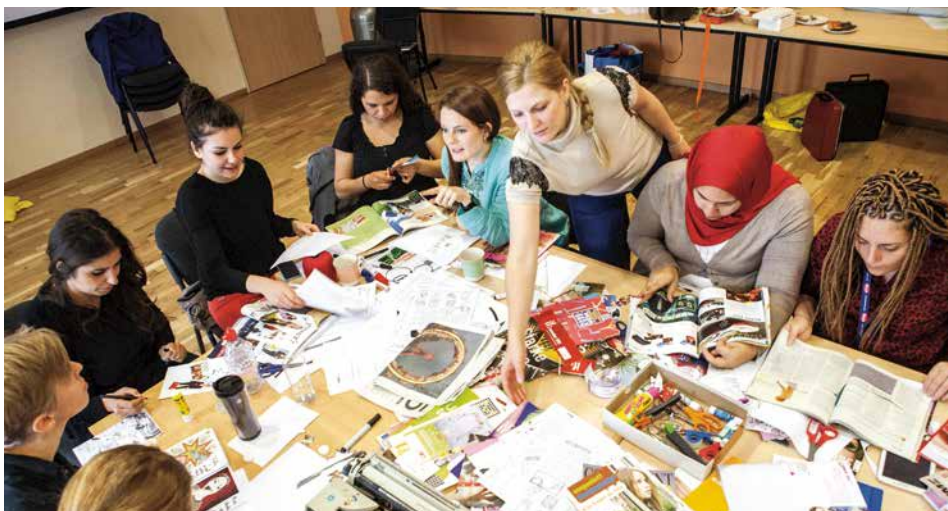
LINKS: „HART & ZART MIT BART“: EINE COMIC-FIGUR, DIE IN EINEM WORKSHOP ENTWICKELT UND IM STADTRAUM VON SALZBURG UND ALS POSTKARTE PRÄSENTIERT WURDE.